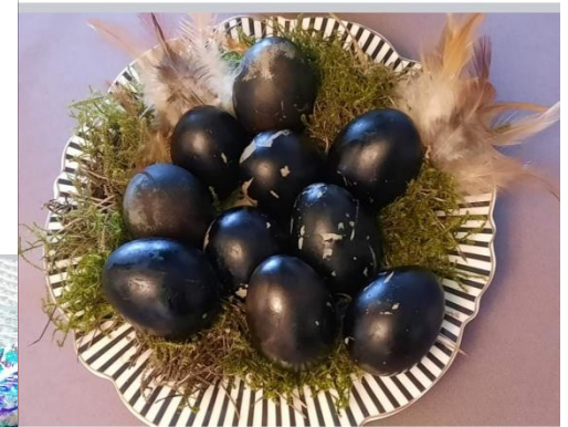
Mykolo, 3 b