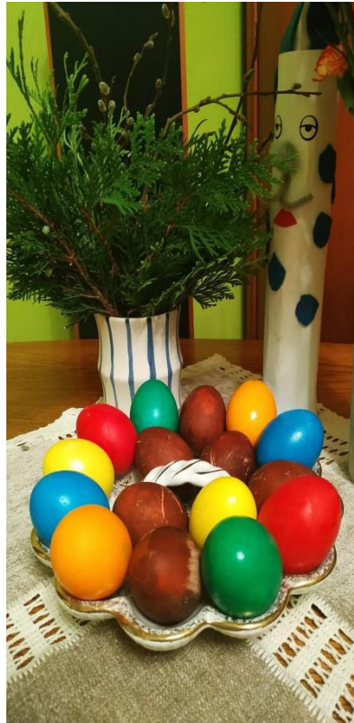
Rugilės (3 b) ir Dovydo (8b)