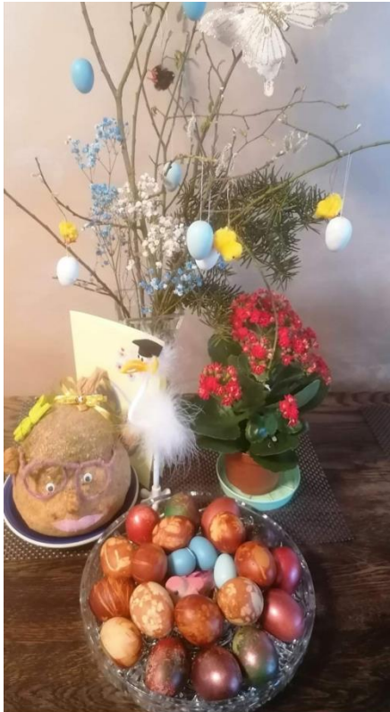
Austėjos, 3 b

Klasės draugai dalijosi, kaip jie namuose margina margučius. Jų margučiais galėjome grožėtis mokyklos organizuotame konkurse „Gražiausias mūsų šeimos margutis“.