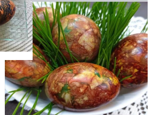
Deimilės 1a, Domanto 3 b